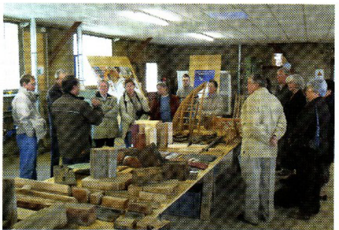
Yonne - Visite de l'atelier de charpente.

de populariser les objectifs de MPF et de nouer des liens avec des associations voisines. Ces activités sont des prémices prometteuses pour la cam-