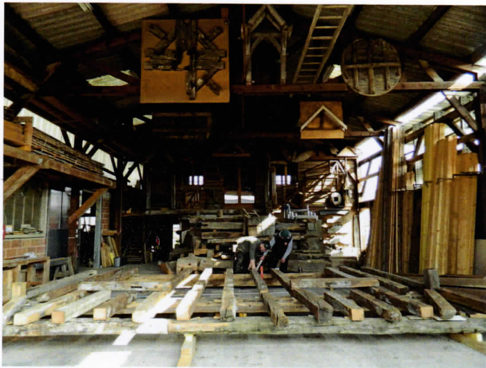
Hangar et atelier Dulion