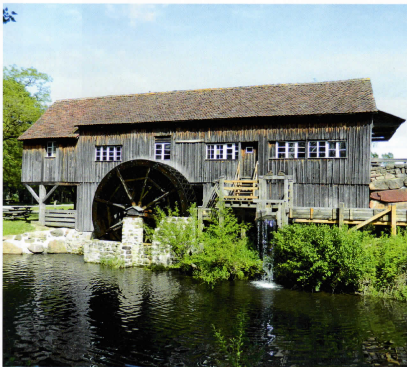
La roue à augets de l'Ecomusée d'Alsace