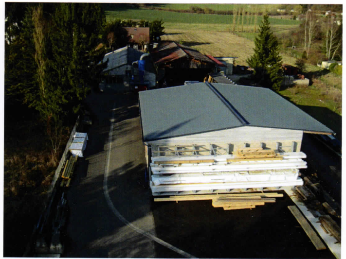
atelier Dulion vue

Benoît constate que depuis 2008, les écarts de prix entre les offres des entreprises s'ouvrent et révèlent une accentuation de la concurrence . Au temps de la croissance, la demande supérieure à l'offre soutenait les prix de la branche et permettait aux entreprises les plus expertes de se situer au-dessus des estimations. Chez Dulion, ce fut une phase d'investissement dans l'équipement, la formation et la sécurité. Aujourd'hui, la crise pousse à la baisse des prix, réduit l'investissement et l'embauche en CDI et emplois qualifiés.